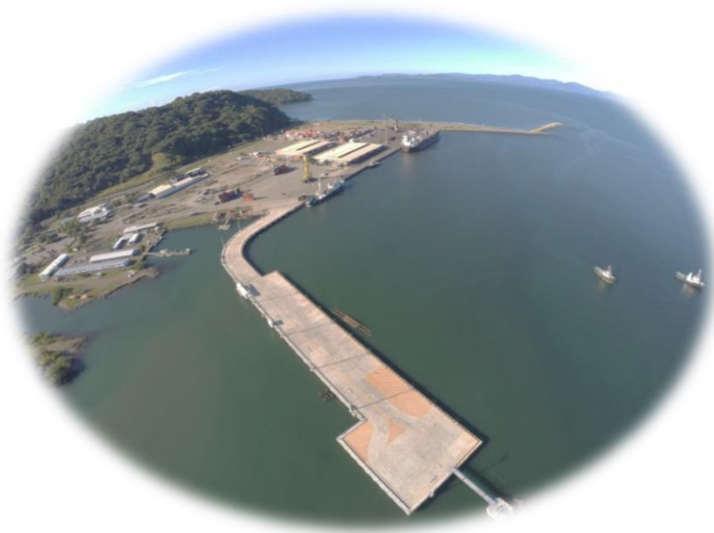
Ilustración 1. Mapa Satelital de Puerto Caldera